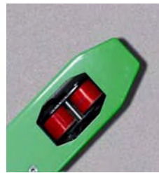
Uitgevoerd met dubbele wieltjes voor verdeling van het gewicht en het beter rijden op oneffen vloeren.